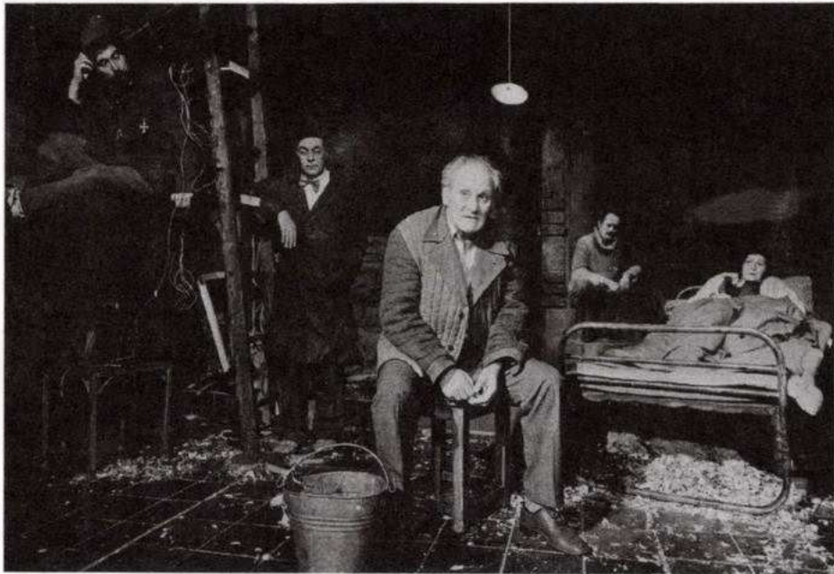
Jelenet Békés Pál Pincejáték című darabjának békéscsabai előadásából

ban megjelenő erkölcsi, társadalmi értékeket, és sok esetben még a konkrét helyszínt, a történések közegét adó drámai teret is. Ezen a viszonylagos szemléleti rokonságon túl azonban a drámaformálás módszerei igen sokfélék.